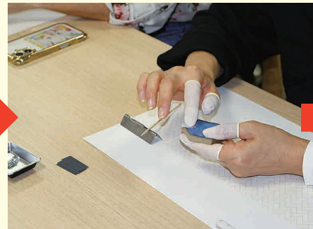
小麦粉から作ったパテで、箸置きの破損部を補修。グルテンの粘着力が鍵になるようです!