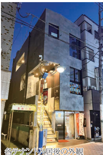
各テナント入居後の外観