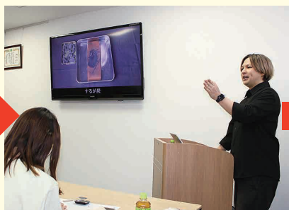
表面を滑らかにするための研磨に関する解説。サンドペーパー以外に炭(するが炭)による伝統的な研磨方法も画像で紹介いただきました!