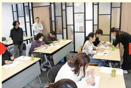
みなさん各々作業に集中!!

参加者の完成写真の一部がこちら! とてもおしゃれですね。 みなさまお疲れさまでした!!