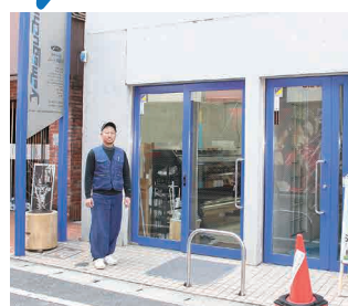
青の縁取りが人目をひく店舗外観&三代目!