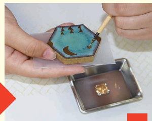
極細の筆で修復部へ金粉入り液体を塗布。絵柄で覆うことで、新たな命が吹き込まれた箸置きに再生。

参加者の完成写真の一部がこちら! とてもおしゃれですね。 みなさまお疲れさまでした!!