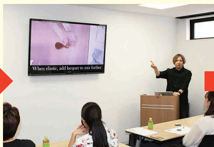
伝統技法では、金粉を補修・結合部に、ふりかけるとのことですが、熟練した技術が必要となるため、一般の方々用に準備した本日使う金粉入り液体の説明。