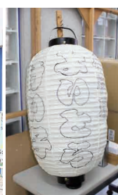
赤ちょうちん用の下書き文字