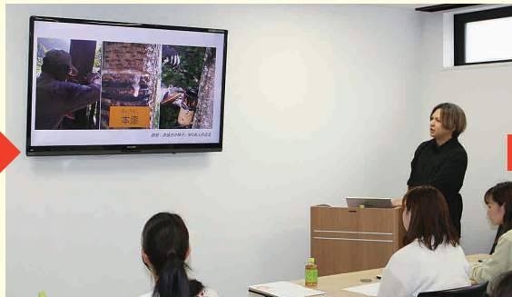
古来より「接着」としても用いられてきた漆(うるし)。熱湯を注ぐ器としては使えるが、鍋など加熱には使えないとのこと。今回の簡易体コースでは、乾燥時間との関係上、漆は使いませんでした。