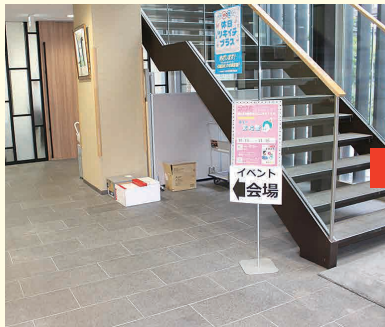
入口に掲示した 「金継ぎ体験ワークショップ」 の案内

10月15日から1ヶ月にわたり開催された新丸子「まちの文化祭」。 弊社は講師の先生2名をお招きし、「金継ぎ体験ワークショップ」で参加しました。 金継ぎの基礎知識を学びながら、事前準備した破損した箸置きを用い、修復作業を進めていくスタイル。 壊れた器に新たな命を吹き込むかのように作業は進み、あっという間の1時間半となりました!!