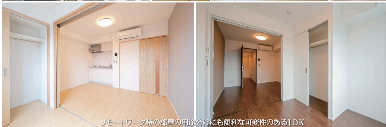
リモートワーク時の部屋の用途分けにも便利な可変性のある1DK