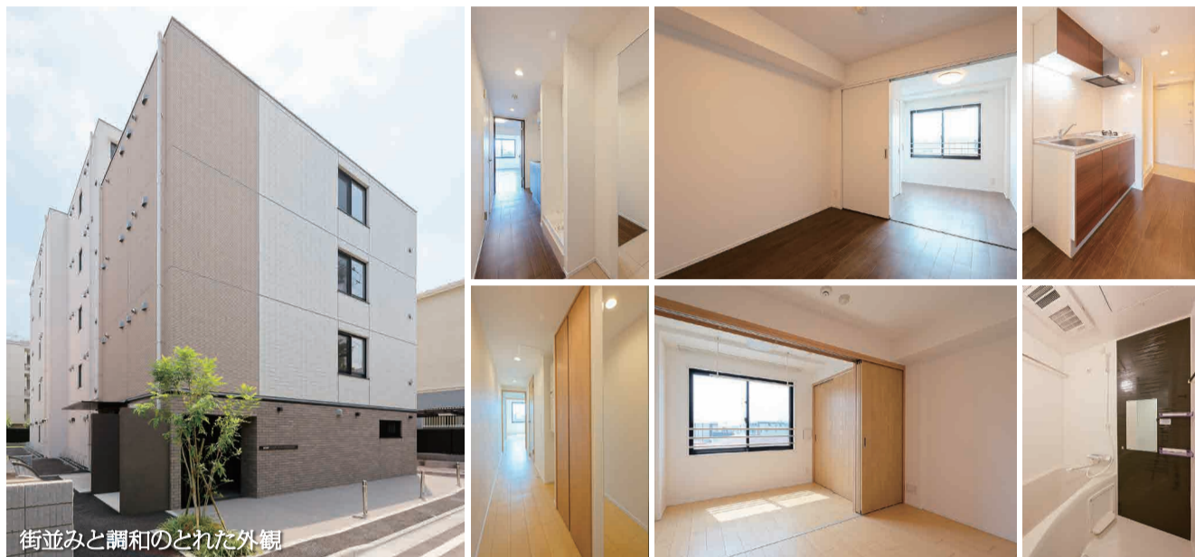
街並みと調和のとれた外観