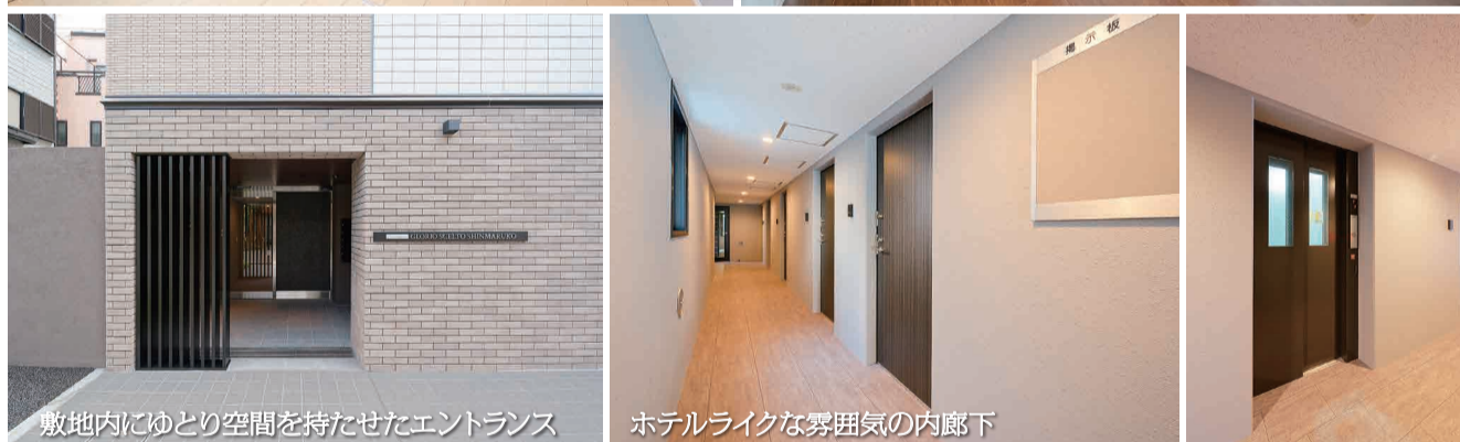
敷地内にゆとり空間を持たせたエントランス