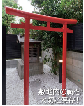
敷地内の祠も 大切に保存!

そんな歴史が色濃く残る旧家の建て替えということで、史跡 保全の面でも慎重にプロジェクトは進められました。