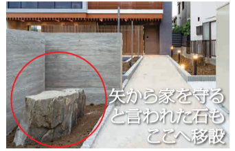
矢から家を守る と言われた石も ここへ移設