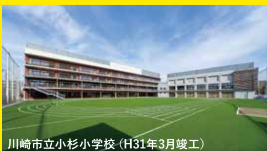
川崎市立小杉小学校 (H31年3月竣工)