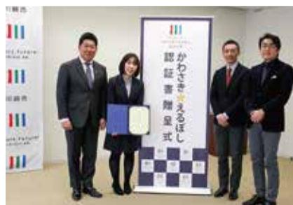
福市長より手渡された認証書

女性の活躍とワークライフバランスの推進のために川崎市が創設した認証制度「かわさき☆えるぼし」。女性活躍をけん引するロールモデル企業として、今年は大山組を含めて19社が認証されました。私たちは性別にかかわらず個性と能力を十分に発揮できる職場を大切にしています！