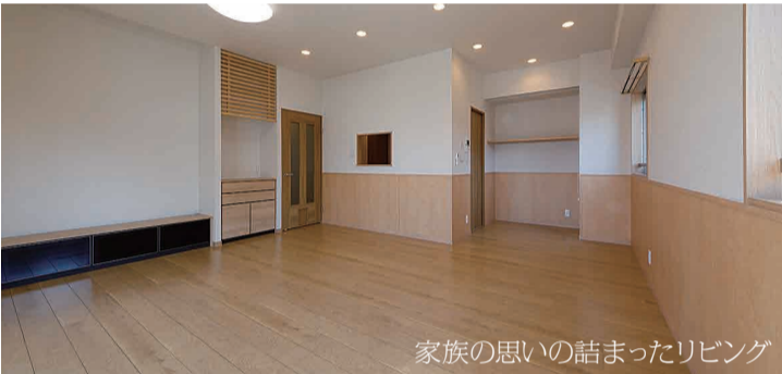
家族の思いの詰まったリビング