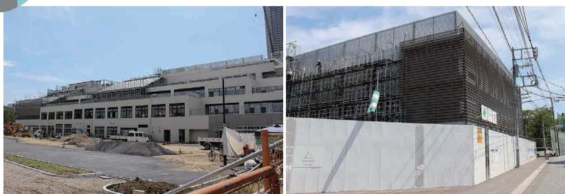
外壁塗装の進む北側壁面(校舎棟)