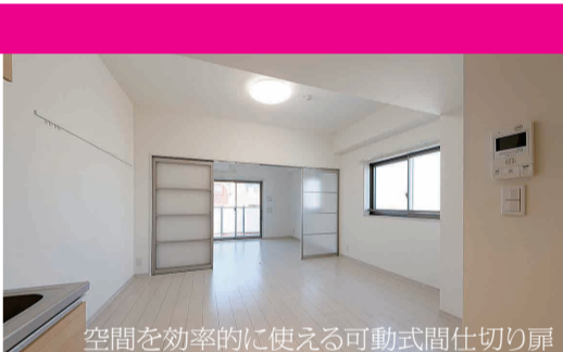
空間を効率的に使える可動式間仕切り扉