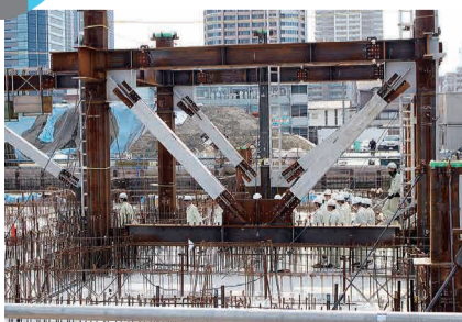
鉄骨建て方の真っ最中！