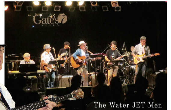
The Water JET Men

竹之内会長は自作の歌でCDも作るシンガーソングライター。社員と結成したライブバンド「The Water JET Men」でライブステージにも立っています！