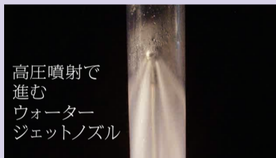
高圧噴射で進むウォータージェットノズル