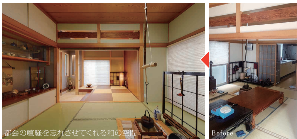
都会の喧騒を忘れさせてくれる和の空間

大手のリフォーム会社数社に相談する中、元気宣言が目にとまり大山組さんへも連絡しました。色々と相談する中、地域密着の安心感とその対応の早さから最終的に大山組さんを選びました。家族それぞれの意向を汲んで頂いた結果、和風の玄関は家族みんなのお気に入りの場所になりました。不要となった家財の処分も手伝って頂くなど、年齢を重ねた夫婦にとってとても心強いリフォームとなりました。大変満足しています。