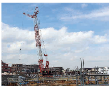
新投入のクローラークレーン

掘削工事を終え、11月から校舎棟の鉄骨工事がスタートしました。鉄骨を組み立てるために新たに投入されたのが120tのクローラークレーン。ブームの長さはなんと77m！半径58m円内の鉄骨や資材など2tのものも自由自在に移動させます。校舎棟のあとは体育館棟へと鉄骨工事は進んでいきます。