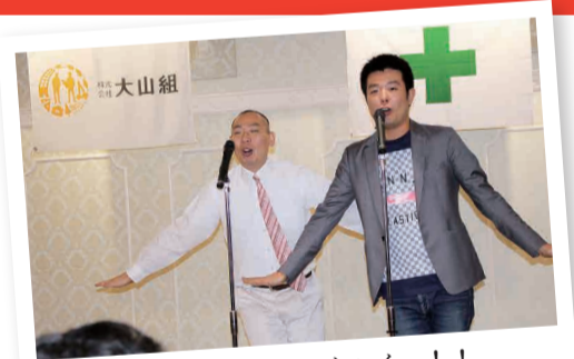
「ハイ、ハイ、ハイハイハイ！！ あるある探検隊！！あるある探検隊！！」