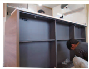
収納パネルを調整中