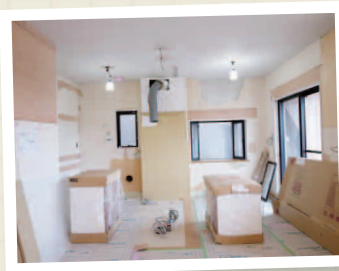
新しいキッチンを搬入