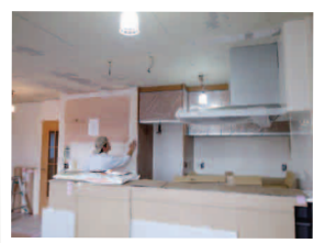
レンジフードも取付け