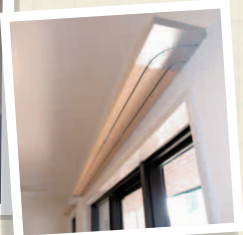
端部の曲がったカーテンレール。隙間がなくなり断熱性が高い