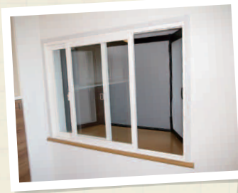
出窓の手前に内窓を取り付け