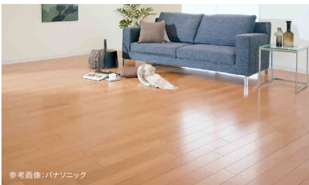
参考画像:パナソニック