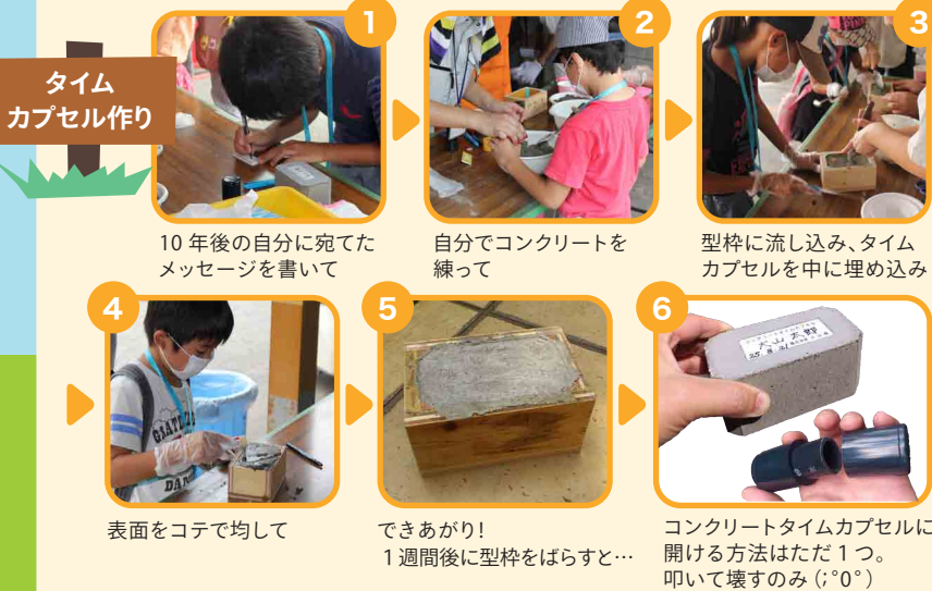
タイムカプセル作り