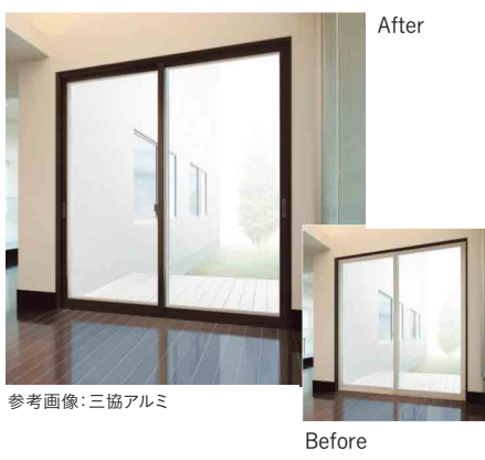
参考画像:三協アルミ