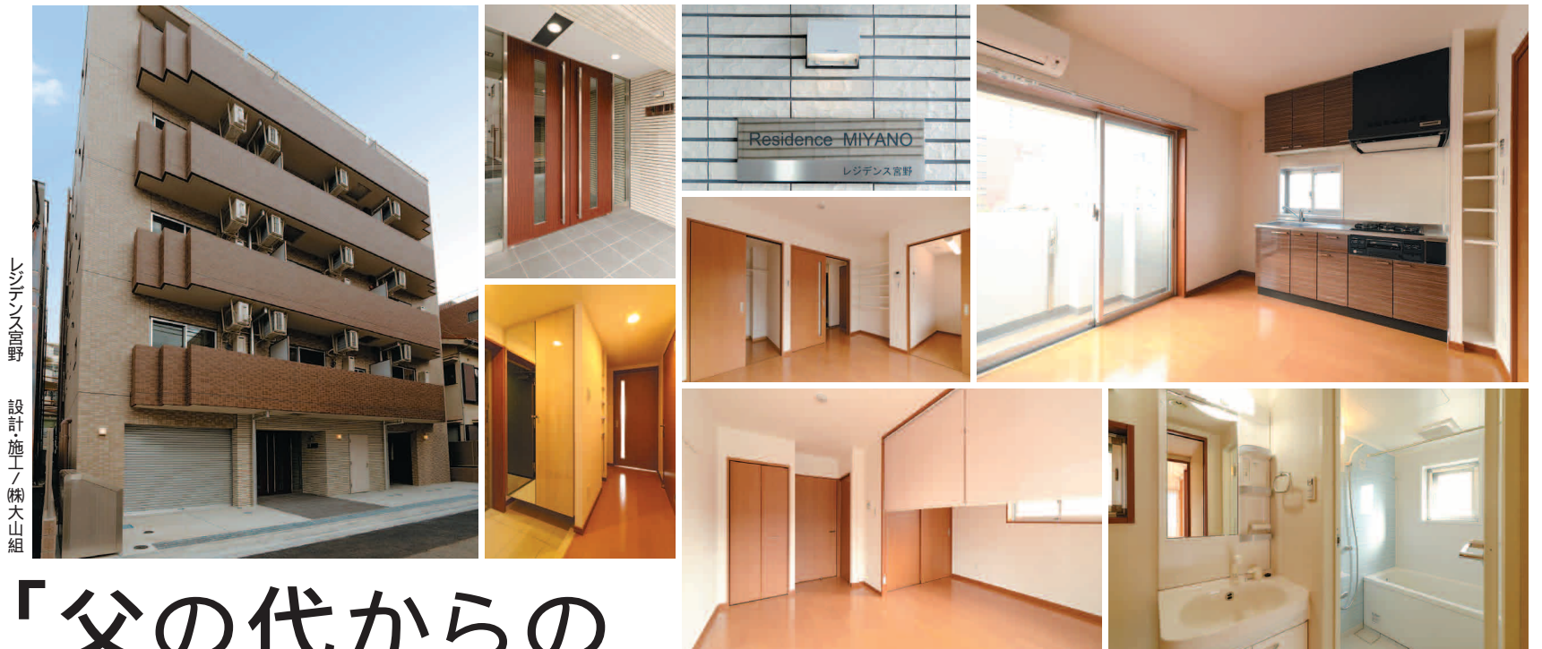
レジデンス宮野 設計・施工 / ㈱大山組