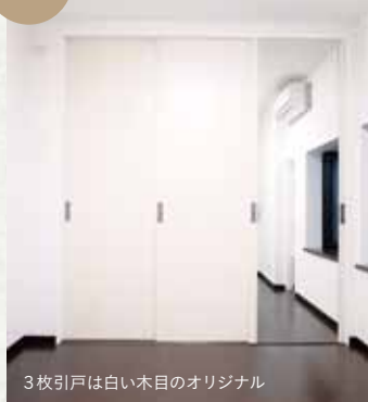
3枚引戸は白い木目のオリジナル