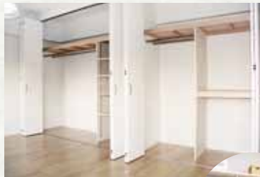
折戸は全面開き、左右に動かせるので出し入れが楽。パイプハンガーと可動棚を組み合わせる。