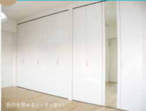
折戸を開めると…すっきり!

以前の子供室2部屋の壁を抜き、ご夫婦の寝室にリフォームしました。広くなった壁一面にクローゼットを造作。洋服はもちろん、かさばる趣味のものやお米のストックも入るよう耐荷重のしっかりした造りにしています。クローゼット扉は約2.3mの高さで、枕棚の物も取り出しやすい大容量収納です。