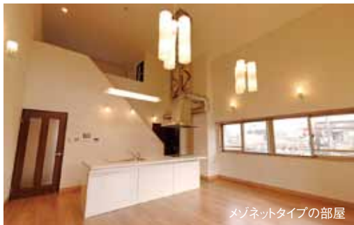
メゾネットタイプの部屋