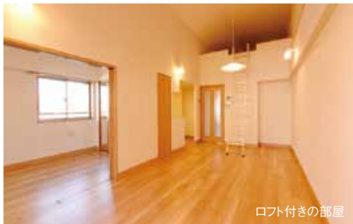
ロフト付きの部屋