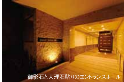
御影石と大理石貼りのエントランスホール