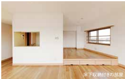
床下収納付きの部屋