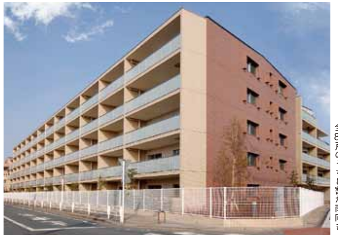
全85戸のうち8割が南向き