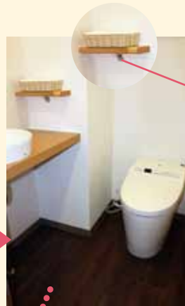
給水管撤去後のプラグ止め。この金具は 撤去できないので、壁をふかして処理するところを 小さな棚板を付けて隠し、ペーパー置きに