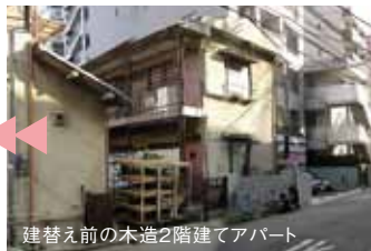
建替前の木造2階建てアパート