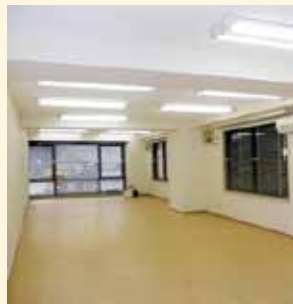
▲もともとはがらんとした事務所でした。

元々、事務所として使われていたため、ミニキッチンとトイレしかなかった部屋を間仕切りで待合室や診療室へと区画。ゆったりとしたトイレや、洗濯機や冷蔵庫も置ける給湯室など、オーナーさんのご要望をコンパクトにまとめてすっきり。限られた予算を有効に使うため、床はフローリングではなく、フロアタイルを敷き詰めました。