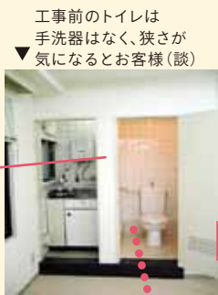
工事前のトイレは 手洗器はなく、狭さが ▼ 気になるとお客様(談)