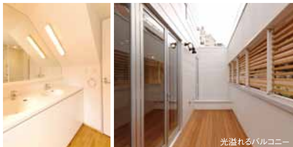
光溢れるバルコニー

「スコットランドでの幼少時代、父は自分でレンガを積み上げて自宅を建てました。その原体験から自分もいつかは家を建てたいとずっと思ってきました。初めは手っとり早さに惹かれ、ハウスメーカーで契約寸前まで行きましたが、デザインに柔軟性がないことと、決して安くはないことを知り、それならば自分の気に入った設計士と地元の信頼できる建設会社をお願いして、思い通りの家を建てようと妻と相談して決めました。住み始めて6カ月経ちますが、回遊性のあるLDKで子供たちが走り回ったり、パーティーのときなどにアイランドキッチンで料理をしながら、廻りに人が集まって賑やかに過ごせるなど、デザインはもちろん住み心地もとても気に入っています。思い通りの家ができて本当に満足していますよ。(笑)」