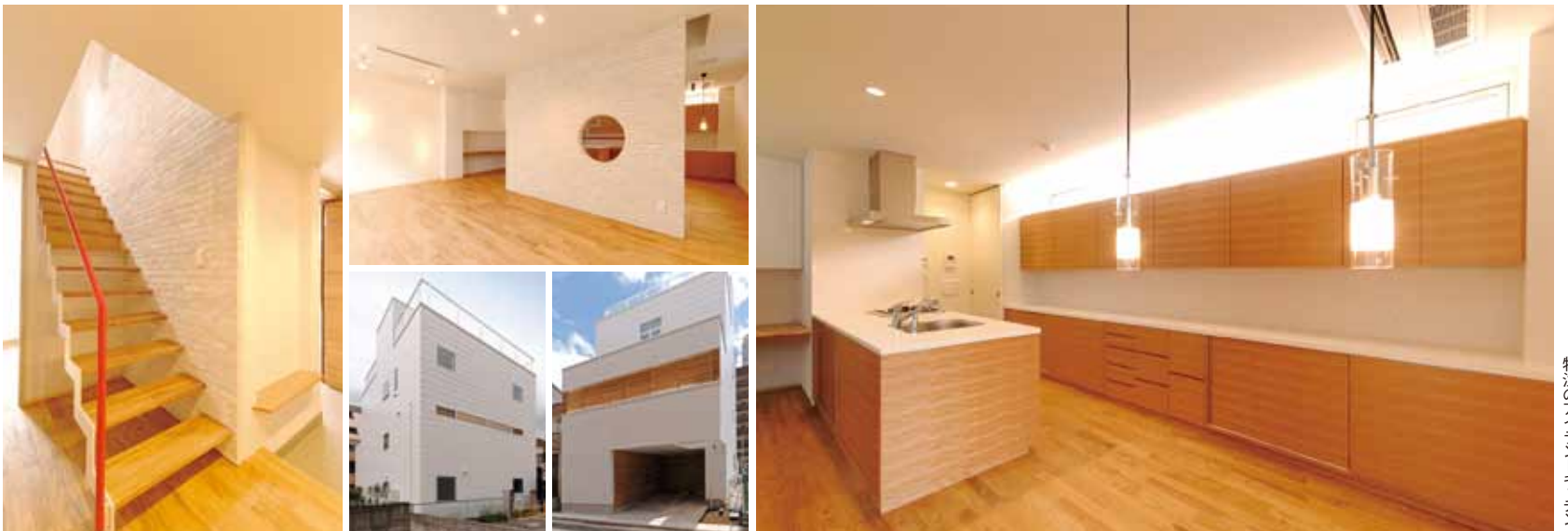
外壁はサイディングを白に塗装