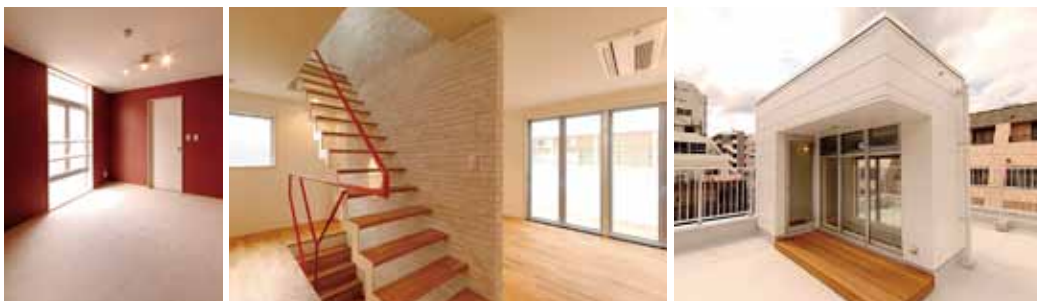
階段を中心にくるりと回れるLDK