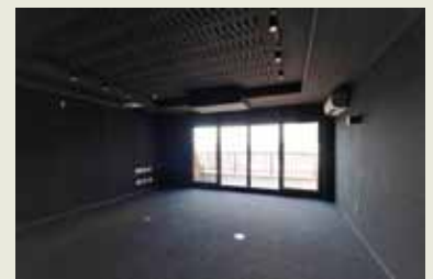
黒の布クロス・タイルカーペットは光の反射をお防音建材を使用。

暗闇を求めたご主人に対して、奥様のご要望は自然の明るい光と風。光が入りづらい玄関や廊下も、引き戸の採用やデザインの工夫、採光ガラスの設置で光と風が回遊する間取りになりました。奥様のくつろぎの場であり、家族だんらんスペースであるLDKと和室には調湿・消臭作用のある珪藻土を使い、これも自然の力を利用し空気を浄化しています。