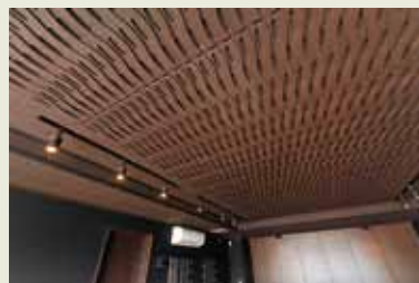
天井・壁仕上げには音響効果をあげる防音建材を使用。