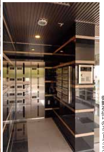
御影石張りのエントランス