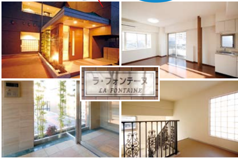
大理石張りのエントランス

【第45号】ご希望の方には毎号直接無料でお送り致します。 こちらまで→ ☎ 0120-6600-62