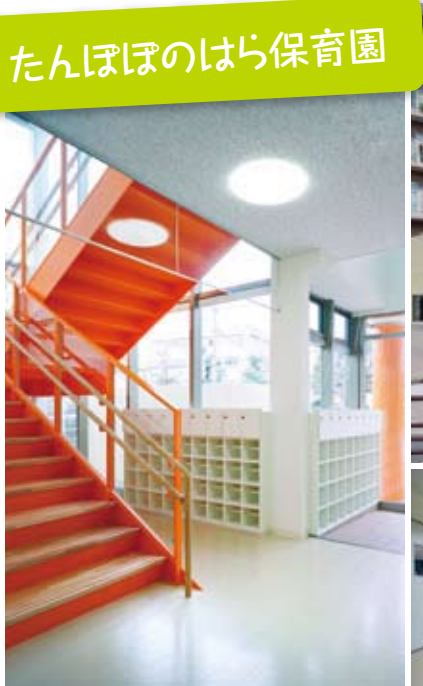
光溢れる玄関ホール

川崎市内で保育園を運営する社会福祉法人大慈会さん。昨年9月に「たんぼぼのはら保育園」を、今年3月に「すみよしのはら保育園」を相次いで新築、開設いたしました。たんぼぼのはらは定員90人、二ヶ領用水のほとりに佇み、エントランスの吹き抜けと黄色の外観が印象的な保育園。すみよしのはらは定員100人、住吉小学校の敷地内に建ち、鮮やかなオレンジ色の外観と荒木田(土俵に使われる粘土質の土)で造られた園庭が特徴の保育園です。それぞれが見た目も個性的で、最新の安心安全な設備がいっぱい。園児にもお母さんにも優しい園舎です。市内の待機児童が待ちに待った2つの新しい保育園の誕生です!