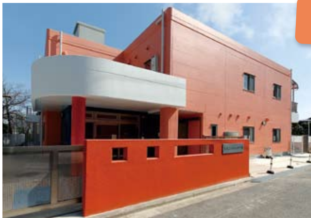
正面エントランス