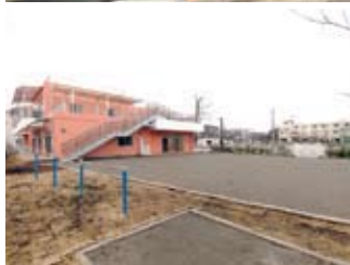
荒木田の園庭。やわらかくて転んでも安心。