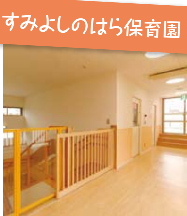
優しい雰囲気の内