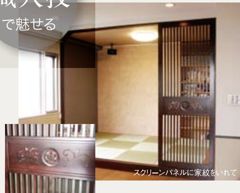
スクリーンパネルに家紋をいれて

最近ではメーカーの既製建具が主流ですがここぞと言うときは、職人さんの技が光るオーダー品は如何ですか? 日本古来の伝統の技から、洗練されたモダンなアイテムまでお望みのままに対応いたします。