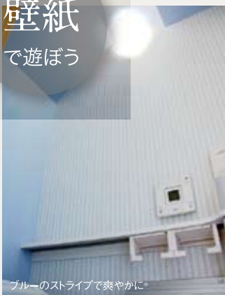
ブルーのストライプで爽やかに