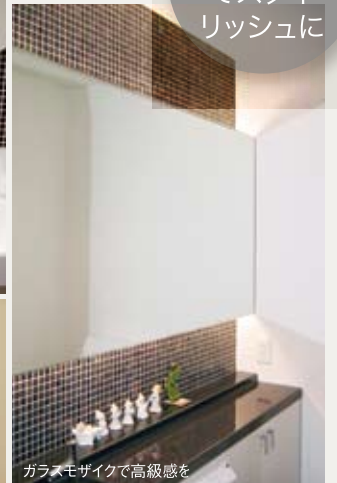
ガラスモザイクで高級感を

最近ではお掃除の面から敬遠されているタイルですがちょっとしたアクセントに使うとグッと存在感がUPします。