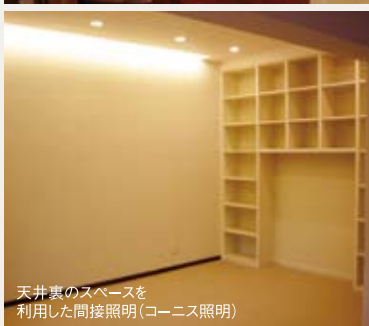
天井裏のスペースを利用した間接照明(コーニス照明)