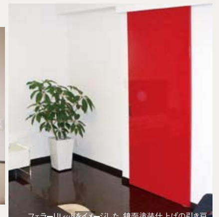
フェラーリレッドをイメージした、鏡面塗装仕上げの引き戸

最近ではメーカーの既製建具が主流ですがここぞと言うときは、職人さんの技が光るオーダー品は如何ですか? 日本古来の伝統の技から、洗練されたモダンなアイテムまでお望みのままに対応いたします。