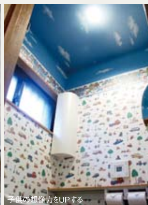
子供の想像力をUPする

壁紙が一番お手軽にデザインを楽しめるアイテムです。色や柄で無限大に変化がつけられます。まずは小スペースのトイレから始めてみませんか?