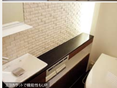
エコカラットで機能性もUP

●エコカラット 立体感が高級感をかもしだす INAX:プレシャスマosaic 7,800円/㎡(材料費)