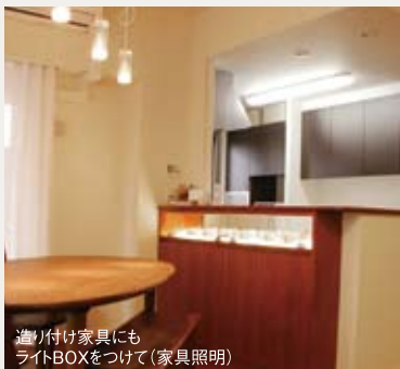
造り付け家具にもライトBOXをつけて(家具照明)

リフォームするきっかけは様々です。壊れたものを修理したり、取り替えたりする修繕的なことから生活スタイルに合せた間取りの改善や、インテリア性を高めたいもっと便利にしたいなど本当に多種多様です。でもせっかくきれいにするのに、ただ直すだけのリフォームではちょっともったいないと思いませんか?そこで、リフォームするときに 少しだけアップグレードした施工事例 をご紹介します。