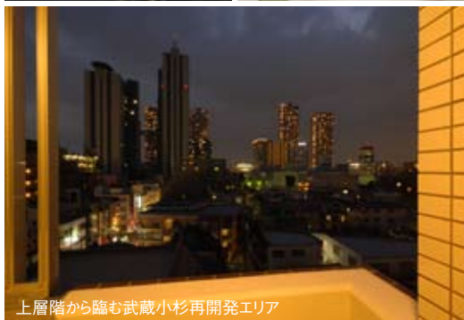
上層階から臨む武蔵小杉再開発エリア