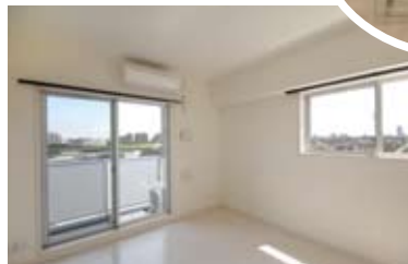
日当たり抜群の居室