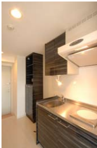
ハイセンスなデザインのキッチン