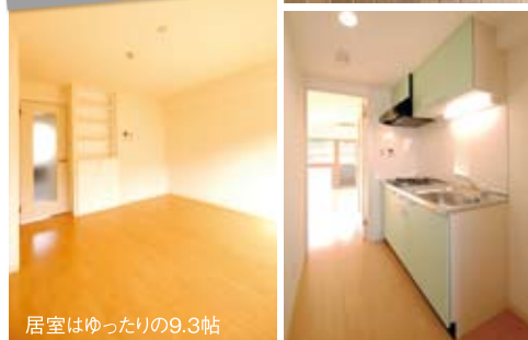
居室はゆったり9.3帖