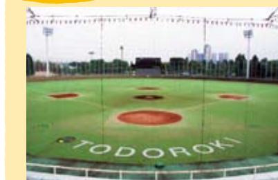
全面人工芝のグラウンド