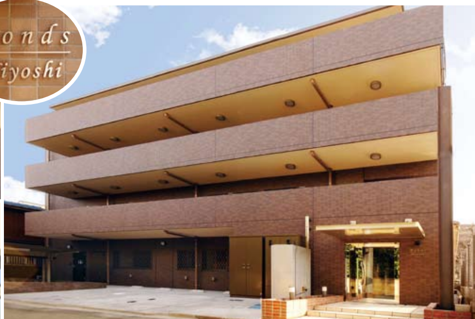
マンション外観。外壁は45丁掛タイル