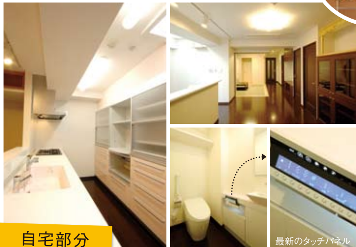
広々のオープンキッチン