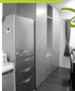
壁面を最大限に活かした造作収納