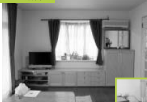
壁をこわさず 配線処理もスッキリ