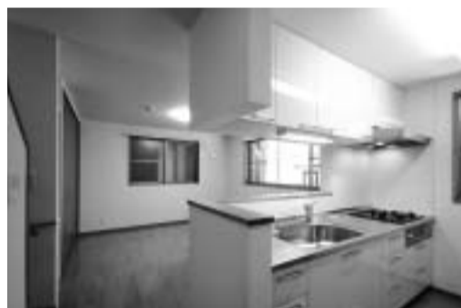
対面式キッチンでリビングは広々

物 ●構造規模/木造2階建住宅 件 ●延床面積/67.89m 2 概 ●所在地/中原区新丸子東 要 ●設計施工/(株)大山組