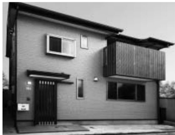
シンプルで落ち着いた外観