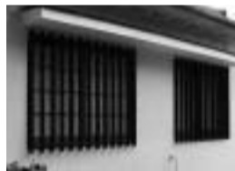
木製の窓格子は木目をつぶさないよう塗装

「まずは、物置き状態となってしまうところを綺麗にしたいと思いました。また、元々純和風だった空間をオフィスらしくしたいと思い、打合せを進めていくなかでイメージをふくらませていきました。」