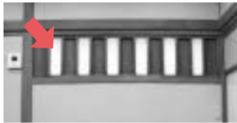
今では珍しい無双窓(むそうまど)