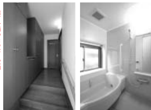
廊下一面のたっぷり収納