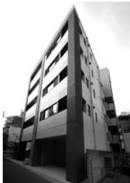
タイルの貼り分けでシャープな外観

ン横のカウンターテーブルも使いやすいとても評判がよく、とにかく全てに大満足です。将来は娘にバトンタッチするつもりですが、以前のビルと比べると、新しいビルは外観も内部の設備もすべて良く出来ているので、精々娘に頑張ってもらって、将来建替えの節は、また大山組さんに面倒を見て頂きたいですね。(笑)」