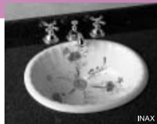
ポーンチャイナのオーバーカウンター式洗面器。水洗金具とあわせてコーディネート。