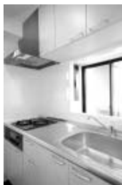
窓のある明るいキッチン