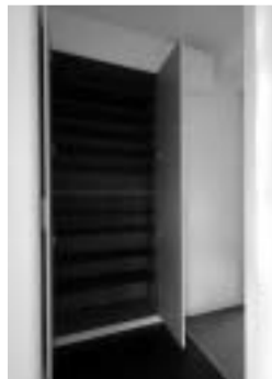
下足入はたっぷり大収納