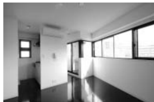
陽あたり抜群の室内