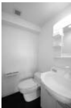
広々としたトイレと洗面台