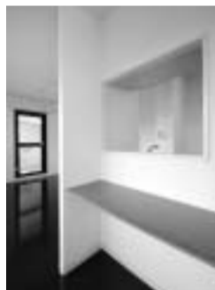
キッチン前のカウンターテーブル

した。それから36年あまり、ずっと賃貸オーナーをしています。今回は駅近くの所有地に単身者用の賃貸マンションを建てました。土地が台形で不整形だったのですが、設計が上手でとてもいいマンションができました。賃貸経営は収益が最優先。必要な部分にはお金をかけますが、無駄な贅沢はしないようにしました。」