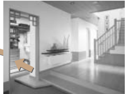
玄関版ウォークインクローゼットです。靴のまま荷物を出し入れできます。