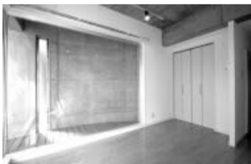
特大サッシで室内はさらに広く

燥機付洗濯機、冷蔵庫、ウォシュレットを標準装備しました。室内の天井はコンクリート打ち放しで通常より高く、開放感に溢れてます。また自転車置場やゴミ置場などの共用部に十分なスペースをとって使い勝手を高めるなど、様々なアイデアを取り入れました。」