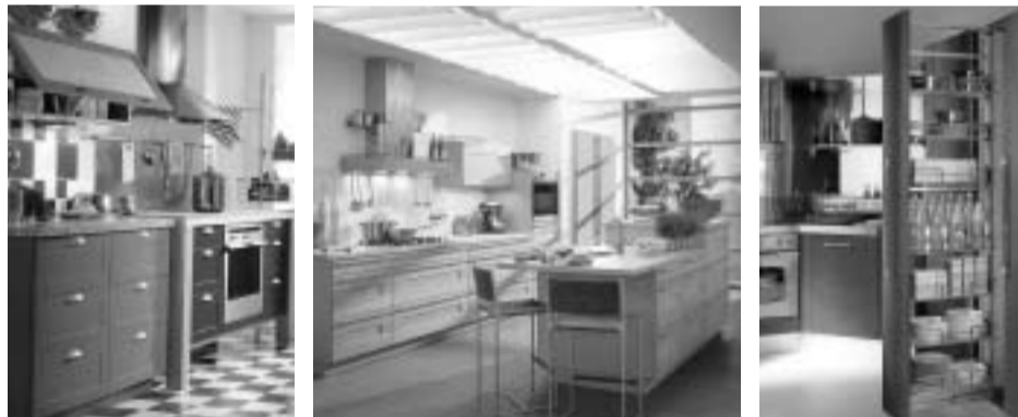
高級家具を思わせる高いデザイン性

日本で人気の海外キッチンの多くはヨーロッパ製。“キッチンが魅せる空間”というヨーロッパならではの発想が、この高いデザイン性を育んできました。魅せたいからレイアウトはオープン型やアイランド型が中心。トップライトや窓から光をふんだんに取り入れることで、デザインが存分に引き立ち、リビングと一体となった開放感溢れる空間が生まれます。限られたスペースでもプラン次第で大変身。あなたも海外キッチンで自宅を“人を呼びたくなる家”にしてみませんか。