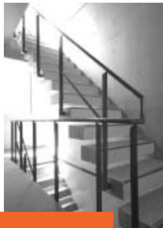
風と光溢れるハイセンスな共用階段

共用部の掃除は毎日欠かさないとK様。今日も元気に入居者の満足のために頑張っています!