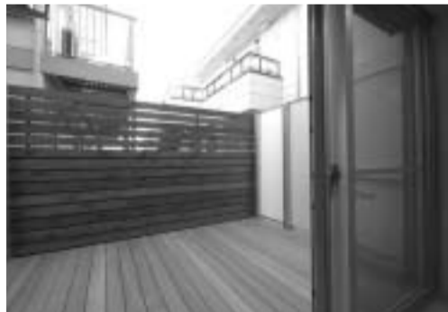
バルコニーはウッドデッキのオープンテラス

「以前は木造アパートで賃貸経営をしていました。しかし老朽化が進んだため4年前に取り壊し、3年間貸駐車場とした後、昨年賃貸マンションに建替えました。こんな時代ですから、建てるにあたっては、長い目で見て競争力が高まるような様々な工夫をしました。まずはデザイン。とにかく自分が住みたくなるようなデザインを目指しました。そのために思い描くイメージを何度も設計士に伝え、