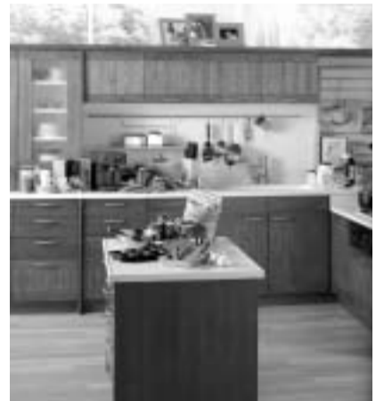
中央に作業台のあるアイランド型