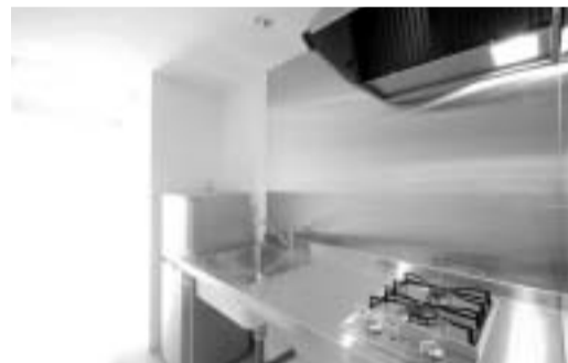
一切の無駄を省いたフロートキッチン

います。苦勞して建てた建物ですから今では自分の分身のようにさえ感じています(笑)大変なこともあります、元々世話好きなので楽しみながらやっています。夫婦共々非常に満足していますよ。」