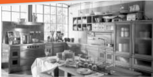
美しいディテール