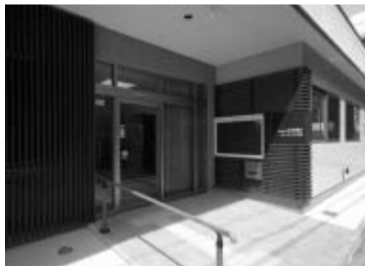
落ち着いた雰囲気のエントランス

地域の高齢者のレクリエーション、健康増進などを目的として、市内51中学校区ごとに設置が進められている老人いこいの家。このたび市内47番目のいこいの家が丸子地区に誕生します。