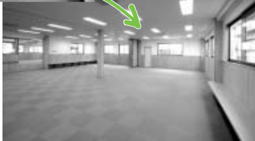
可動間仕切りを開ければ100畳の大広間に