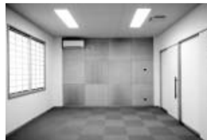
和風テイストを取り込んだクラブ室

ネーターを加えて色や材料の選定を行ったことで、細かいところにも配慮の行き届いた、カラダに優しい、これまでにない新しいデザインのいこいの家となりました。