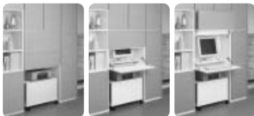
こんなパソコン収納も