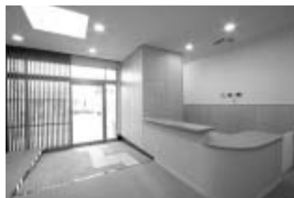
広々としたエントランスホール

老人いこいの家とは、60歳以上のお年寄りを対象に、高齢者がいつまでも現役で自立できるための様々な取り組みを行う、川崎市を事業主体とした公共施設です。ミニデイサロン・会食活動・配食活動などの地域福祉活動、いこいの家祭りなどの地域住民との交流行事、市民活動を実施している団体への夜間・休日開放など、地域に開かれた施設として大きな役割を担っています。