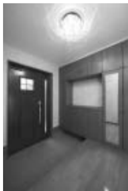
二世帯共用の玄関。