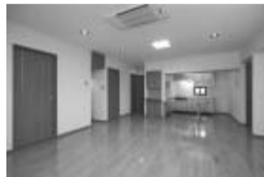
キッチンとリビングは19畳の大空間。

新社屋を建てるのが今の夢という田通社長。今日も家から会社から、豪快な笑い声が聞こえています。