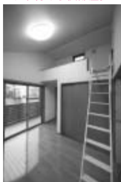
ロフト付の子供部屋。