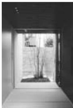
和室から望む庭の白樺。

「設計事務所の紹介などで5社から見積をとって最終的に大山組さんに決めました。工事中は近くに仮住まいをしていたので毎日現場を見ていましたが、工事の手配から近隣への配慮まで本当によくやってくれました。私たちの意見もよく聞いてくれたし、営業マンから現場監督までみな真面目で仕事が丁寧で本当に驚きました。いま思えばよくあの金額でこれだけの仕事をしてくれた