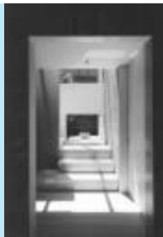
開放的なリビング。 天井高は3.75m。

地域密着型総合建設会社 創業60年 ohyama 株式会社 大山組 フリーダイヤル 0120-6600-62 神奈川県川崎市中原区新丸子東1-827 www.ohyamagumi.co.jp