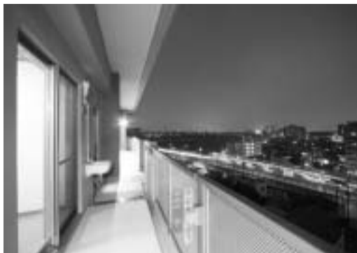
ご自宅の8階ベランダから広がる夜景。東京タワーや羽田を飛び立つ飛行機も見えるそう。

「職業柄色んな建設会社を知っていたので初めは何社かに相談を持ちかけました。値段、評判、施工力、まじめさなどを考慮して途中から大手と2社に絞って検討しましたが、最終的な決め手はやっぱりアフターサービスかな。」