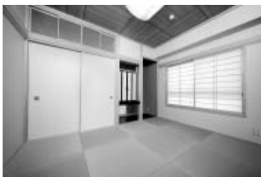
和室には造り付けの仏壇と床下収納が。畳の下には奥様ご希望の掘りごたつも。

建物は完成後のメンテナンスが一番大切だから。やっぱり何かあったときには大手さんより地域密着型のほうが安心でしょう。駅近くの仮住まいと駐車場をタダで貸してくれるサービスも助かりました。」