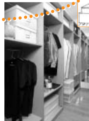
スライディングガラスドア

隣り合う2つの部屋の間には思い切ってウォークスルークローゼットを造りましょう。2つの部屋からアクセスできる便利さと、スーツケースやスキー板など大きな物を何でもしまえる収納力は抜群の使い勝手です。入口にアルミフレームのモダンなスライディングガラスドアをつければたちまち高級マンションの佇まいに早変わりです。