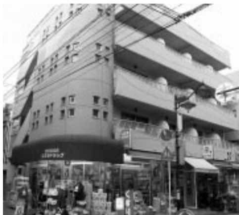
建替え後のマンション

建替えの計画は3年前にスタートしました。「長屋なので4軒共同で建替えることになったのですが、地元の大山組に相談したところ資金計画から、融資の紹介、4軒の権利調整、設計、施工、賃貸管理まで全てトータルに相談に乗ってくれた。実際に必要な段取りも面倒なことも全てしてくれました。よく動いてくれました。今思えばそれが非常によかったですね。」