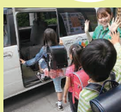
ご家族も安心。専用バスでの送迎