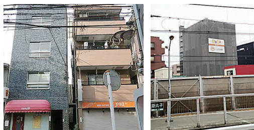
Before 左棟：S45年竣工 右棟：H11年竣工 東急線新丸子駅ホームから見える建設中のオーボワL est

オーナー様のご意向を詳しく伺ったところ、「左棟は建て替えるが、築年数の浅い右棟に関しては、時期を見て建て替えたい。」とのことでした。そしてオーナー様との話し合いを進める中で、大山組としての提案方針を定めました。